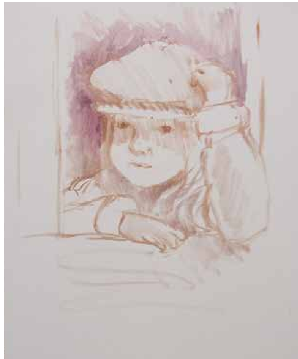
כאן ציירתי את התמונה בעזרת מכחול בגוון חום - סגול